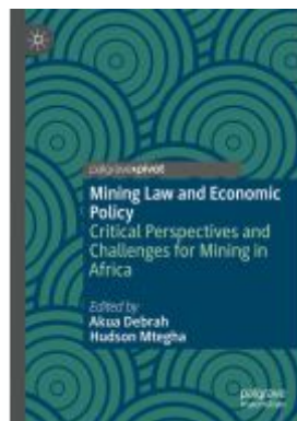
Mining Law and Economic Policy Ladenpreis: 49,49EUR