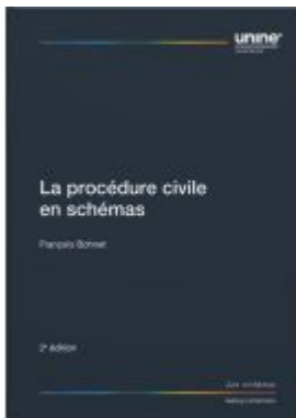
La procédure civile en schémas Ladenpreis: 86,00EUR

Wir haben andere Produkte gefunden, die Ihnen gefallen könnten!