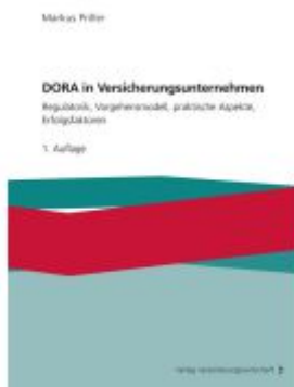
DORA in Versicherungsunternehmen Ladenpreis: 71,80EUR