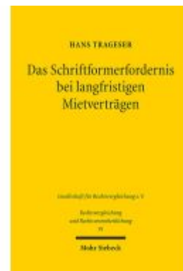
Das Schriftformerfordernis bei langfristigen Mietverträgen Ladenpreis: 81,30EUR