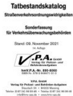
15. Ergänzungslieferung zum Bundeseinheitlicher Tatbestandskatalog, Sonderfassung für Verkehrsüberwachung Ladenpreis: 10,50EUR