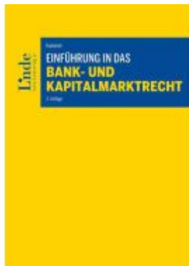
Einführung in das Bank- und Kapitalmarktrecht Ladenpreis: 62,00EUR