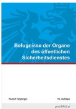
Befugnisse der Organe des öffentlichen Sicherheitsdienstes Ladenpreis: 22,00EUR