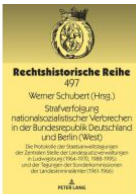
Strafverfolgung nationalsozialistischer Verbrechen in der Bundesrepublik Deutschland und Berlin (West) Ladenpreis: 112,00EUR