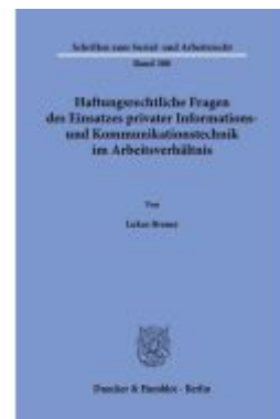
Haftungserrechtliche Fragen des Einsatzes privater Informations- und Kommunikationstechnik im Arbeitsverhältnis. Ladenpreis: 102,70EUR