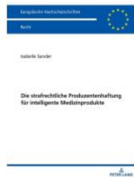
Die strafrechtliche Produzentenhaftung für intelligente Medizinprodukte Ladenpreis: 56,50EUR