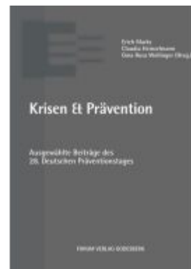
Krisen & Prävention Ladenpreis: 40,10EUR