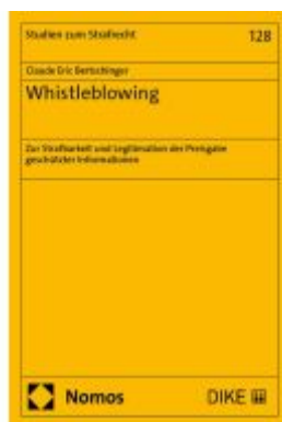
Whistleblowing Ladenpreis: 76,10EUR