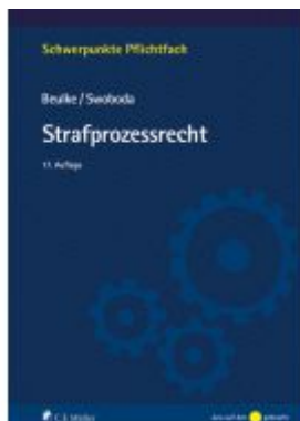
Strafprozessrecht Ladenpreis: 28,80EUR