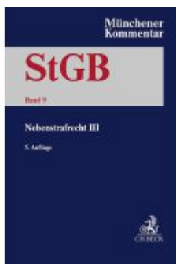
Münchener Kommentar zum Strafgesetzbuch Bd. 9: Nebenstrafrecht III Ladenpreis: 379,40EUR