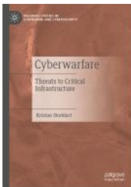
Cyberwarfare Ladenpreis: 142,99EUR