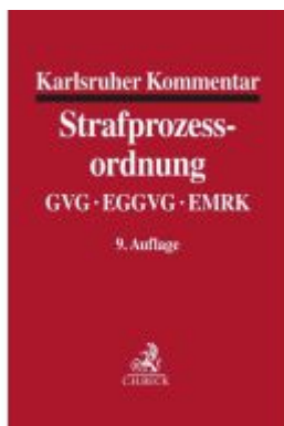
Karlsruher Kommentar zur Strafprozessordnung Ladenpreis: 307,40EUR