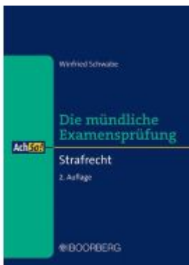
Strafrecht Ladenpreis: 20,40EUR

Wir haben andere Produkte gefunden, die Ihnen gefallen könnten!