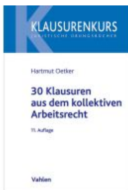
30 Klausuren aus dem kollektiven Arbeitsrecht Ladenpreis: 25,60EUR