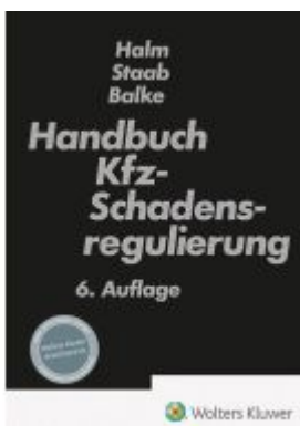
Handbuch der Kfz-Schadensregulierung Ladenpreis: 194,30EUR