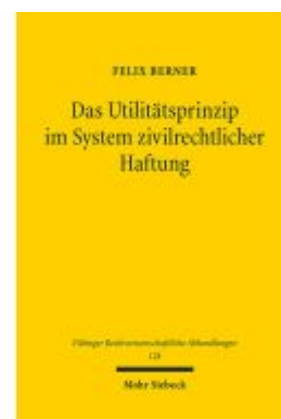
Das Utilitätsprinzip im System zivilrechtlicher Haftung Ladenpreis: 127,50EUR