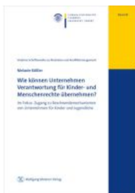
Wie können Unternehmen Verantwortung für Kinder- und Menschenrechte übernehmen? Ladenpreis: 20,50EUR