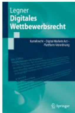
Digitales Wettbewerbsrecht Ladenpreis: 30,83EUR

Wir haben andere Produkte gefunden, die Ihnen gefallen könnten!