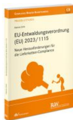
EU-Entwaldungsverordnung (EU) 2023/1115 Ladenpreis: 50,40EUR