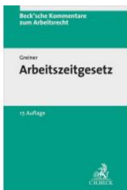
Arbeitszeitgesetz Ladenpreis: 138,80EUR