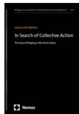
In Search of Collective Action Ladenpreis: 142,90EUR