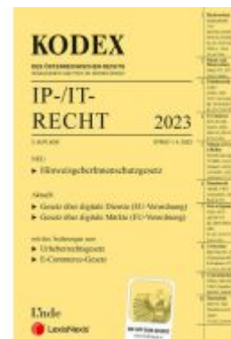
KODEX IP-/IT-Recht 2023 - inkl. App Ladenpreis: 69,00EUR