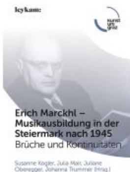
Erich Marckhl – Musikausbildung in der Steiermark nach 1945 Ladenpreis: 32,00EUR