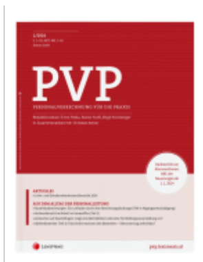
PVP Zeitschrift - Jahres-Abonnement (12 Hefte) Ladenpreis: 0,00EUR