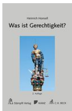
Was ist Gerechtigkeit? Ladenpreis: 29,00EUR