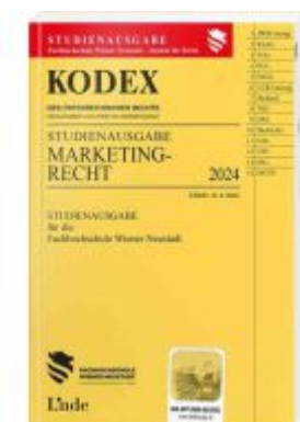
KODEX Studienausgabe Marketingrecht Ladenpreis: 24,00EUR