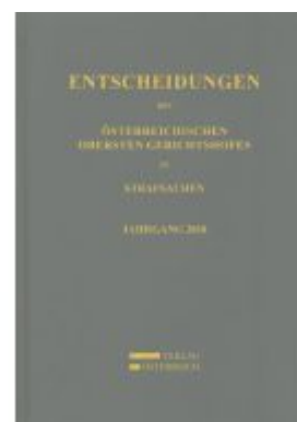
Entscheidungen des Österreichischen Obersten Gerichtshofes in Strafsachen Ladenpreis: 164,00EUR