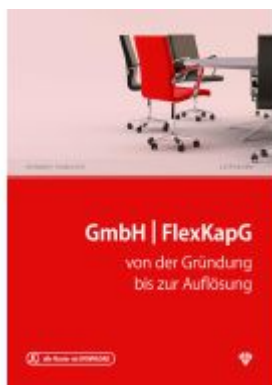
GmbH & FlexKapG Ladenpreis: 44,00EUR