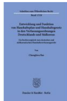
Entwicklung und Funktion von Haushaltsplan und Haushaltsgesetz in den Verfassungsordnungen Deutschlands und Südkoreas. Ladenpreis: 82,20EUR