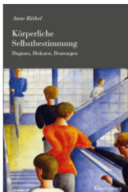
Körperliche Selbstbestimmung Ladenpreis: 40,10EUR