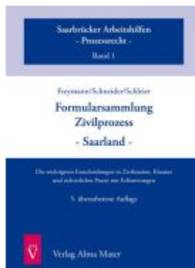
Formularsammlung Zivilprozess - Saarland - 5. Auflage Ladenpreis: 23,50EUR