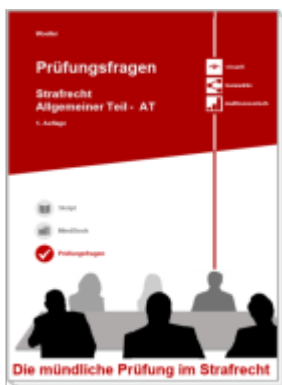
Prüfungsfragen - Die mündliche Prüfung im Strafrecht Ladenpreis: 15,40EUR