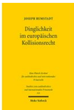
Dinglichkeit im europäischen Kollisionsrecht Ladenpreis: 92,60EUR