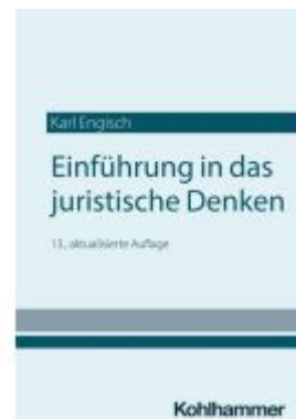
Einführung in das juristische Denken Ladenpreis: 22,60EUR