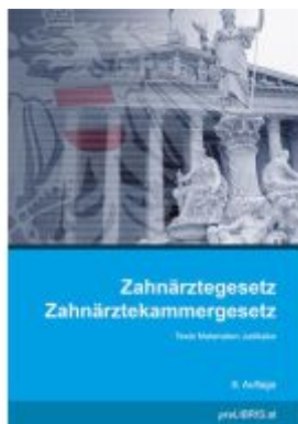
Zahnärztegesetz / Zahnärztekammergesetz Ladenpreis: 32,00EUR