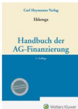
Handbuch der AG-Finanzierung Ladenpreis: 256,00EUR