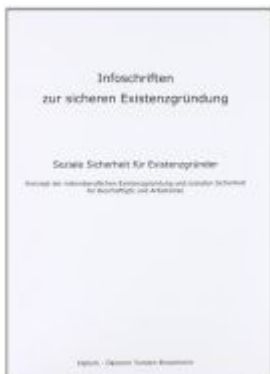
Infoschriften zur sicheren Existenzgründung - Soziale Sicherheit für Existenzgründer Ladenpreis: 40,10EUR