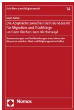
Die Absprache zwischen dem Bundesamt für Migration und Flüchtlinge und den Kirchen zum Kirchenasyl Ladenpreis: 117,20EUR