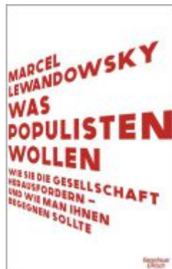
Was Populisten wollen Ladenpreis: 20,60EUR