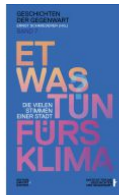
Etwas tun fürs Klima Ladenpreis: 22,00EUR