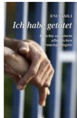
Ich habe getötet Ladenpreis: 24,00EUR