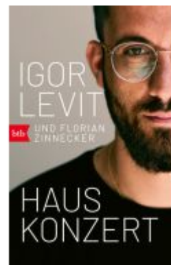
Hauskonzert Ladenpreis: 14,40EUR