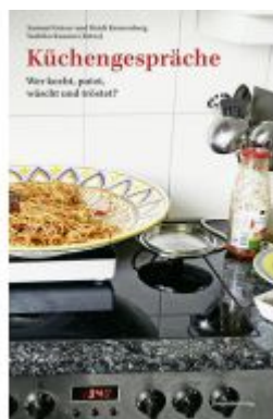
Küchengespräche Ladenpreis: 35,00EUR