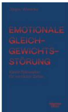
Emotionale Gleichgewichtsstörung Ladenpreis: 20,60EUR