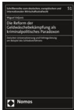
Die Reform der Geldwäschebekämpfung als kriminalpolitisches Paradoxon Ladenpreis: 101,80EUR