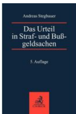
Das Urteil in Straf- und Bußgeldsachen Ladenpreis: 71,00EUR