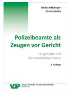
Polizeibeamte als Zeugen vor Gericht Ladenpreis: 27,70EUR