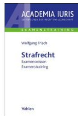
Strafrecht Ladenpreis: 51,20EUR