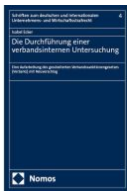
Die Durchführung einer verbandsinternen Untersuchung Ladenpreis: 122,40EUR