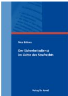
Der Sicherheitsdienst im Lichte des Strafrechts Ladenpreis: 91,40EUR