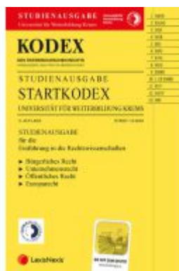
KODEX Startkodex Krens 2024/25 - inkl. App Ladenpreis: 28,00EUR