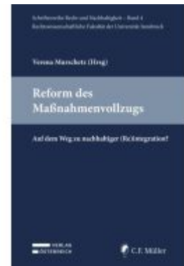
Reform des Maßnahmenvollzugs Ladenpreis: 45,30EUR