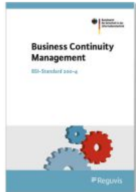
Business Continuity Management Ladenpreis: 50,40EUR