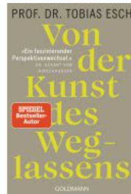
Von der Kunst des Weglassens Ladenpreis: 13,40EUR