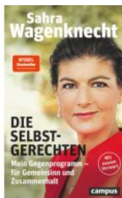
Die Selbstgerechten Ladenpreis: 15,50EUR