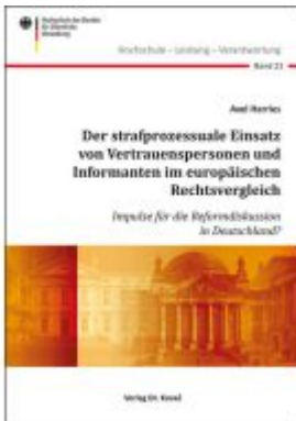
Der strafprozessuale Einsatz von Vertrauenspersonen und Informanten im europäischen Rechtsvergleich Ladenpreis: 143,80EUR