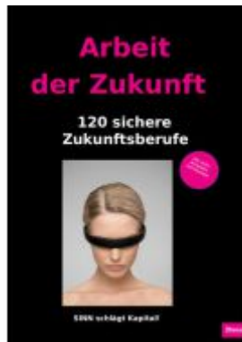
Arbeit der Zukunft Ladenpreis: 20,40EUR