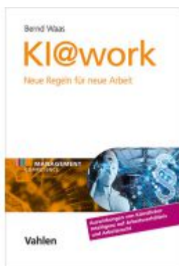
KI@work Ladenpreis: 51,20EUR