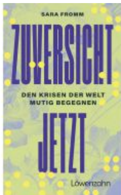
Zuversicht jetzt Ladenpreis: 22,90EUR

Wir haben andere Produkte gefunden, die Ihnen gefallen könnten!