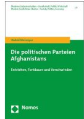
Die politischen Parteien Afghanistans Ladenpreis: 81,30EUR