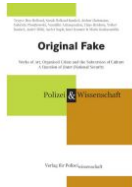
Original Fake Ladenpreis: 33,90EUR