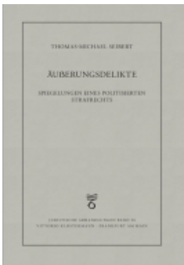
Äußerungsdelikte Ladenpreis: 91,50EUR