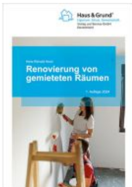
Renovierung von gemieteten Räumen Ladenpreis: 17,50EUR