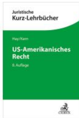
US-Amerikanisches Recht Ladenpreis: 46,20EUR