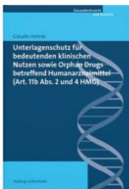
Unterlagenschutz für bedeutenden klinischen Nutzen sowie Orphan Drugs betreffend Humanarzneimittel (Art. 11b Abs. 2 und 4 HMG) Ladenpreis: 71,00EUR