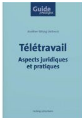
Télétravail Ladenpreis: 75,00EUR