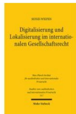
Digitalisierung und Lokalisierung im internationalen Gesellschaftsrecht Ladenpreis: 76,10EUR