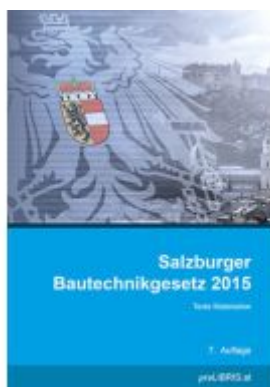
Salzburger Bautechnikgesetz 2015 Ladenpreis: 25,00EUR