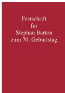
Festschrift für Stephan Barton zum 70. Geburtstag Ladenpreis: 277,60EUR