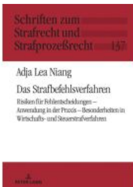
Das Strafbefehrsverfahren Ladenpreis: 123,30EUR

Wir haben andere Produkte gefunden, die Ihnen gefallen könnten!