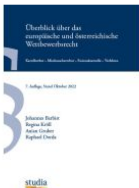
Überblick über das europäische und österreichische Wettbewerbsrecht Ladenpreis: 14,20EUR