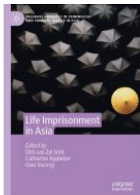
Life Imprisonment in Asia Ladenpreis: 153,99EUR