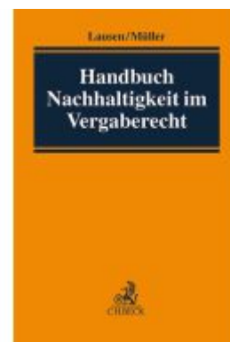
Handbuch Nachhaltigkeit im Vergaberecht Ladenpreis: 142,90EUR