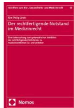
Der rechtfertigende Notstand im Medizinrecht Ladenpreis: 101,80EUR