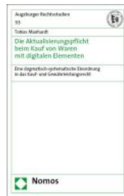
Die Aktualisierungspflicht beim Kauf von Waren mit digitalen Elementen Ladenpreis: 71,00EUR