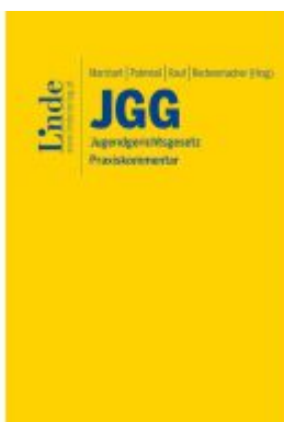
JGG | Jugendgerichtsgesetz Ladenpreis: 77,00EUR