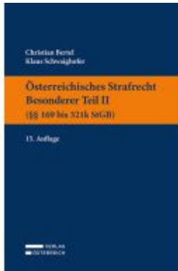
Österreichisches Strafrecht. Besonderer Teil II ( §§ 169 bis 321k StGB) Ladenpreis: 39,00EUR