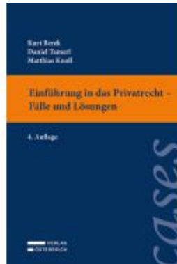
Einführung in das Privatrecht - Fälle und Lösungen Ladenpreis: 29,00EUR