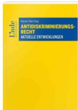
Antidiskriminierungsrecht Ladenpreis: 38,00EUR