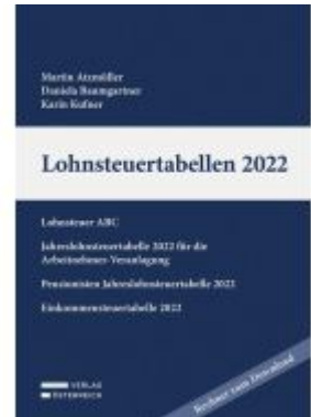
Lohnsteuertabellen 2022 Ladenpreis: 58,00EUR