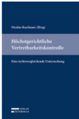
Höchstgerichtliche Vertretbarkeitskontrolle Ladenpreis: 49,00EUR