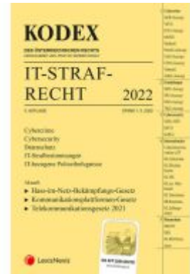
KODEX IT-Strafrecht 2022 - inkl. App Ladenpreis: 30,00EUR