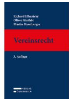
Vereinsrecht Ladenpreis: 98,00EUR