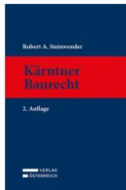
Kärntner Baurecht Ladenpreis: 434,00EUR