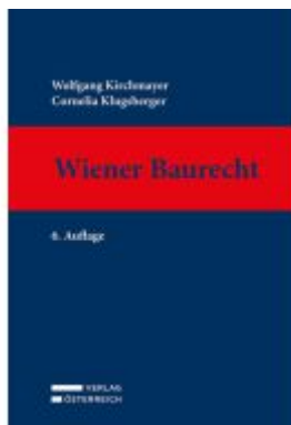
Wiener Baurecht Ladenpreis: 169,00EUR