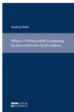
Effektive Verfahrenshilfeverteidigung im österreichischen Strafverfahren Ladenpreis: 79,00EUR