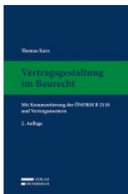
Vertragsgestaltung im Baurecht Ladenpreis: 159,00EUR