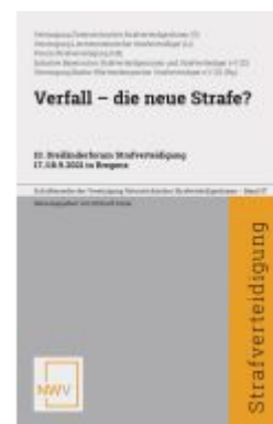
Verfall - die neue Strafe? Ladenpreis: 58,00EUR