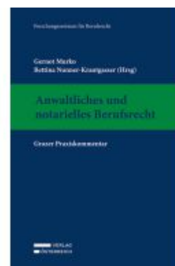
Anwaltliches und notarielles Berufsrecht Ladenpreis: 389,00EUR