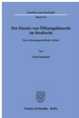
Der Einsatz von Öffnungsklauseln im Strafrecht. Ladenpreis: 92,50EUR

Wir haben andere Produkte gefunden, die Ihnen gefallen könnten!