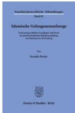
Islamische Gefangenenseelsorge. Ladenpreis: 102,70EUR