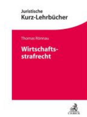
Wirtschaftsstrafrecht Ladenpreis: 30,90EUR