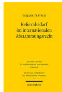
Reformbedarf im internationalen Abstammungsrecht Ladenpreis: 91,50EUR