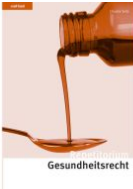
Repetitorium Gesundheitsrecht Ladenpreis: 76,00EUR