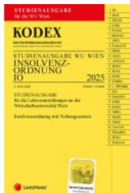
KODEX Insolvenzzordnung für die WU 2025 - inkl. App Ladenpreis: 15,00EUR