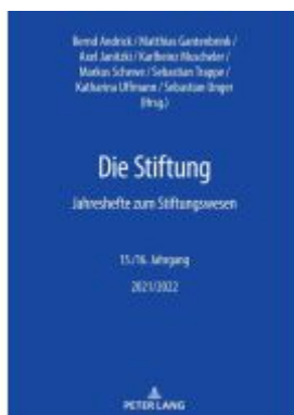
Die Stiftung Ladenpreis: 56,50EUR