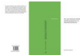
Der querstehende Beteiligte Ladenpreis: 49,50EUR