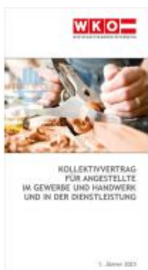
Kollektivvertrag für Angestellte im Gewerbe und Handwerk und in der Dienstleistung Ladenpreis: 6,90EUR