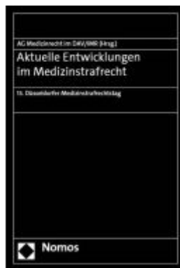
Aktuelle Entwicklungen im