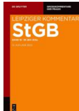
§§ 284-305a Ladenpreis: 179,00EUR