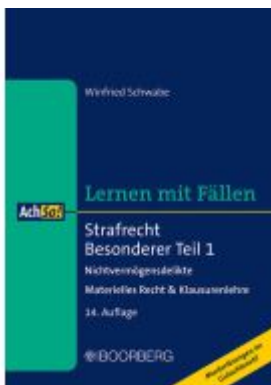
Strafrecht Besonderer Teil 1