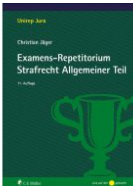
Examens-Repetitorium Strafrecht Allgemeiner Teil Ladenpreis: 28,80EUR

Wir haben andere Produkte gefunden, die Ihnen gefallen könnten!