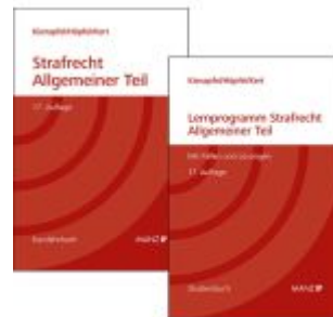
PAKET: Grundriss des Strafrechts 17. Aufl BR + Lernprogramm 17. Aufl Allgemeiner Teil Ladenpreis: 105,20EUR