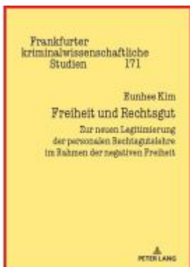
Freiheit und Rechtsgut Ladenpreis: 51,40EUR