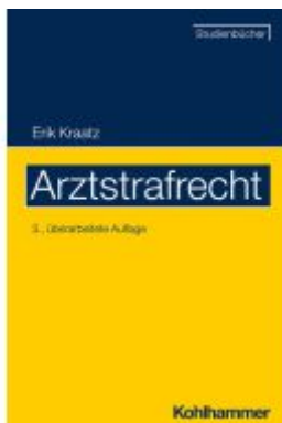
Arztstrafrecht Ladenpreis: 37,00EUR