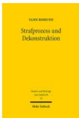
Strafprozess und Dekonstruktion Ladenpreis: 112,10EUR