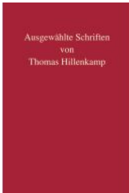
Ausgewählte Schriften von Thomas Hillenkamp Ladenpreis: 287,90EUR