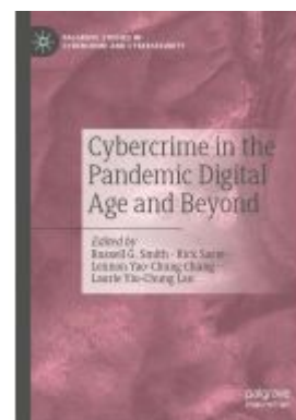
Cybercrime in the Pandemic Digital Age and Beyond Ladenpreis: 153,99EUR