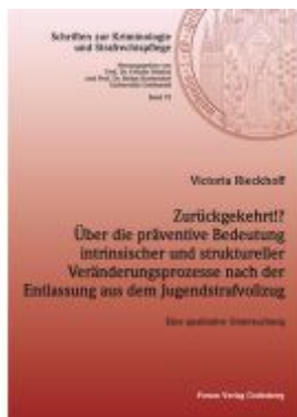
Zurückgekehrt!? Über die präventive Bedeutung intrinsischer und struktureller Veränderungsprozesse nach der Entlassung aus dem Jugendstrafvollzug Ladenpreis: 45,30EUR