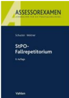
StPO-Fallrepetitorium Ladenpreis: 27,70EUR