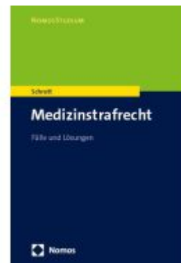
Medizinstrafrecht Ladenpreis: 29,80EUR