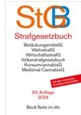
Strafgesetzbuch Ladenpreis: 13,30EUR