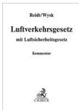
Luftverkehrsgesetz Ladenpreis: 153,20EUR