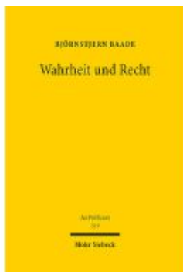
Wahrheit und Recht Ladenpreis: 148,10EUR