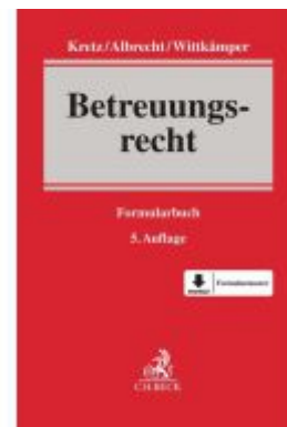
Betreuungsrecht Ladenpreis: 87,40EUR