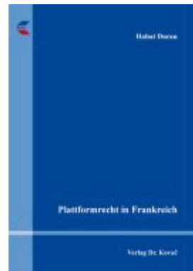
Plattformrecht in Frankreich Ladenpreis: 102,60EUR