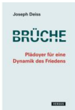
Brüche - Plädoyer für eine Dynamik des Friedens Ladenpreis: 29,80EUR