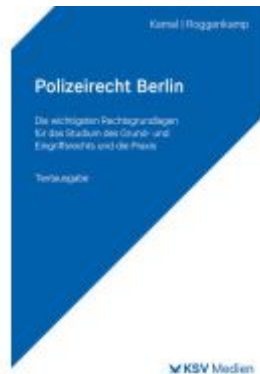
Polizeirecht Berlin Ladenpreis: 25,70EUR