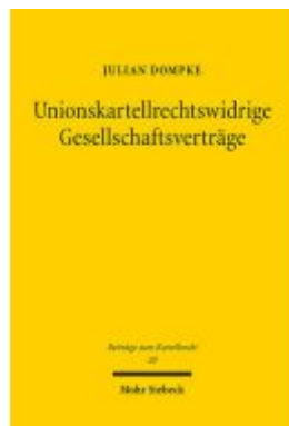
Unionskartellrechtswidrige Gesellschaftsverträge Ladenpreis: 81,30EUR