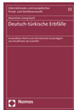
Deutsch-türkische Erbfälle Ladenpreis: 91,50EUR