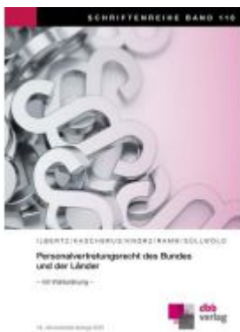
Personalvertretungsrecht des Bundes und der Länder Ladenpreis: 39,50EUR