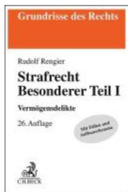
Strafrecht Besonderer Teil I Ladenpreis: 27,70EUR