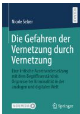
Die Gefahren der Vernetzung durch Vernetzung Ladenpreis: 102,80EUR