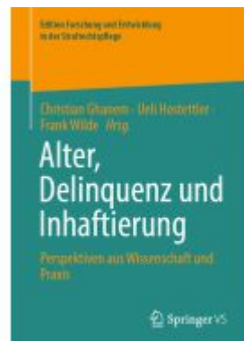
Alter, Delinquenz und Inhaftierung Ladenpreis: 61,67EUR