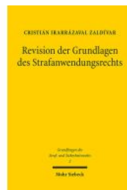
Revision der Grundlagen des Strafanwendungsrechts Ladenpreis: 107,00EUR