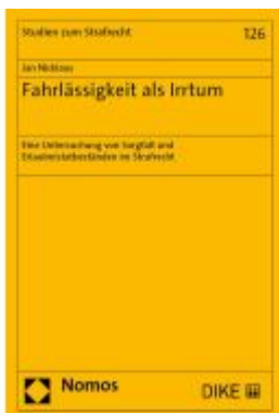
Fahrlässigkeit als Irrtum Ladenpreis: 76,10EUR

Wir haben andere Produkte gefunden, die Ihnen gefallen könnten!