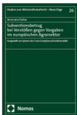
Subventionsbetrug bei Verstößen gegen Vorgaben im europäischen Agrarsektor Ladenpreis: 127,50EUR