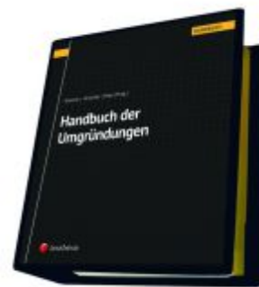
Handbuch der Umgründungen