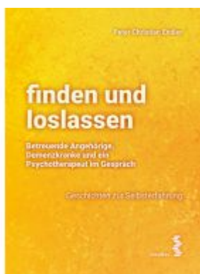
finden und loslassen Betreuende Angehörige, Demenzkranke und ein Psychotherapeut im Gespräch