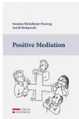
Positive Mediation Ladenpreis: 26,00 EUR