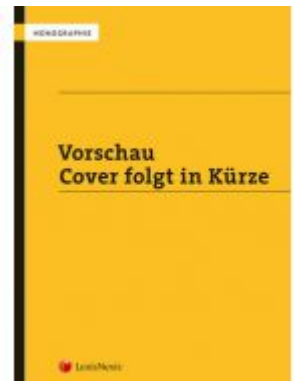
Erfüllungsgehilfen - Gehilfenzurechnung nach ABGB und VersVG Ladenpreis: 49,00 EUR