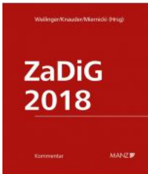
Kommentar zum Zahlungsdienstegesetz ZaDiG 2018 Aktionspreis: 198,00 EUR Ladenpreis: 239,00 EUR

Wir haben andere Produkte gefunden, die Ihnen gefallen könnten!