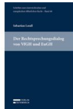
Der Rechtsprechungsdialog von VfGH und EuGH Ladenpreis: 84,00EUR