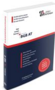
BGB AT Ladenpreis: 29,80EUR