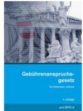
Gebührenanspruchsgesetz Ladenpreis: 25,00EUR