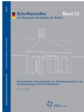
Kriminalistische Entscheidungen im Ermittlungsverfahren und ihre Auswirkungen auf das Strafverfahren Ladenpreis: 10,00EUR