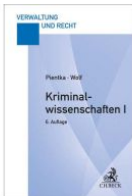
Kriminalwissenschaften I Ladenpreis: 27,70EUR