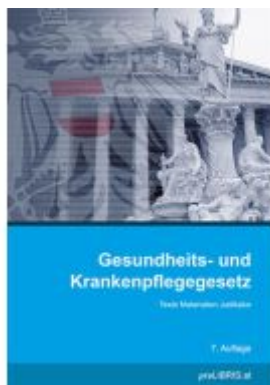
Gesundheits- und Krankenpflegegesetz Ladenpreis: 39,00EUR