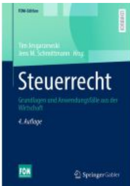
Steuerrecht Ladenpreis: 51,39EUR

Wir haben andere Produkte gefunden, die Ihnen gefallen könnten!