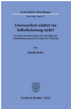
Unwissenheit schützt vor Selbstbelastung nicht? Ladenpreis: 71,90EUR