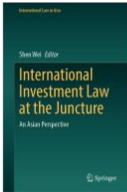
International Investment Law at the Juncture Ladenpreis: 197,99EUR