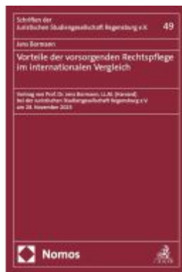
Vorteile der vorsorgenden Rechtspflege im internationalen Vergleich Ladenpreis: 19,60EUR