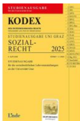
KODEX Studienausgabe Sozialrecht Graz 2025 Ladenpreis: 12,00EUR