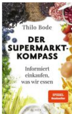
Der Supermarkt-Kompass Ladenpreis: 22,70EUR