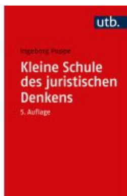
Kleine Schule des juristischen Denkens Ladenpreis: 21,60EUR