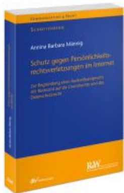
Schutz gegen Persönlichkeitsrechtsverletzungen im Internet Ladenpreis: 91,50EUR