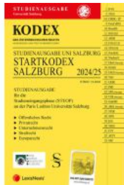
KODEX Startkodex Salzburg 2024/25 - inkl. App Ladenpreis: 21,00EUR