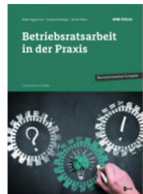
Betriebsratsarbeit in der Praxis Ladenpreis: 39,00EUR