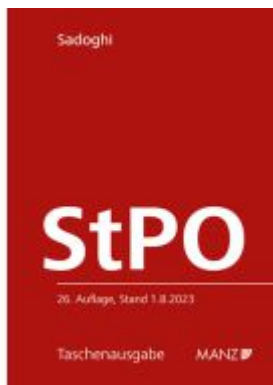
Strafprozessordnung StPO Ladenpreis: 24,80EUR