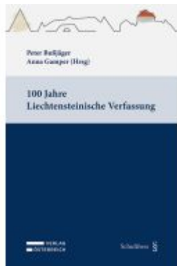
100 Jahre Liechtensteinische Verfassung Ladenpreis: 49,00EUR