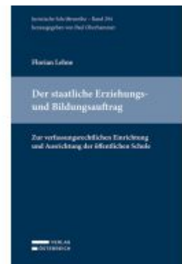
Der staatliche Erziehungs- und Bildungsauftrag Ladenpreis: 72,00EUR

Alle Preise inkl. MwSt. zzgl. Versand. Bei Bestellung im LexisNexis Onlineshop kostenloser Versand innerhalb Österreichs.