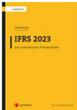
IFRS 2023 Ladenpreis: 48,00EUR