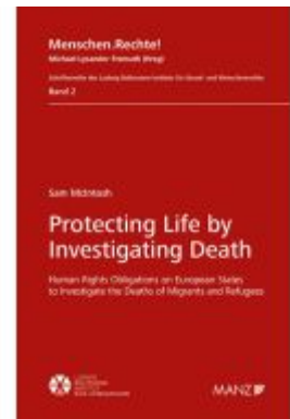
Protecting Life by Investigating Death Ladenpreis: 84,00EUR