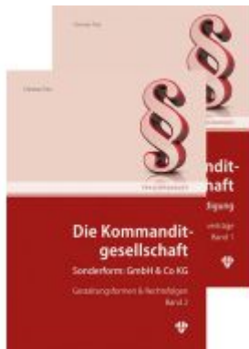
Die Kommanditgesellschaft Set: Band 1 +2 Ladenpreis: 109,00EUR

Wir haben andere Produkte gefunden, die Ihnen gefallen könnten!