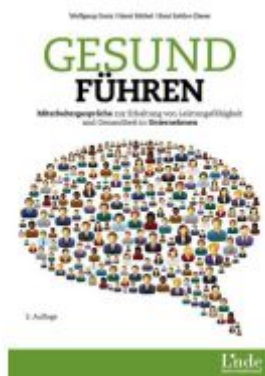
Gesund führen Ladenpreis: 29,90EUR