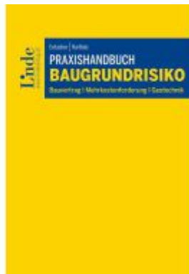
Praxishandbuch Baugrundrisiko Ladenpreis: 44,00EUR