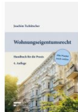
Wohnungseigentumsrecht Ladenpreis: 69,00EUR