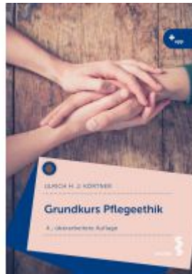
Grundkurs Pflegeethik Ladenpreis: 26,90EUR