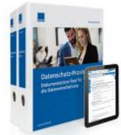
Datenschutz-Praxis Ladenpreis: 239,80EUR