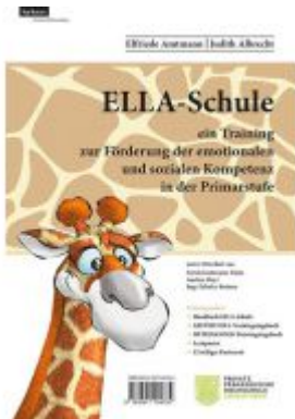
ELLA - Schule - ein Training zur Förderung der emotionalen und sozialen Kompetenz in der Primarstufe Ladenpreis: 42,00EUR

Wir haben andere Produkte gefunden, die Ihnen gefallen könnten!