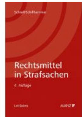
Rechtsmittel in Strafsachen Ladenpreis: 48,00EUR