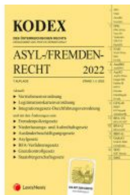
KODEX Asyl- und Fremdenrecht 2022 - inkl App Ladenpreis: 48,00EUR