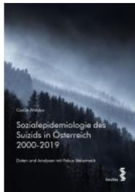
Sozialepidemiologie des Suizids in Österreich 2000-2019 Ladenpreis: 26,90EUR