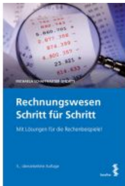
Rechnungswesen Schritt für Schritt Ladenpreis: 46,00EUR