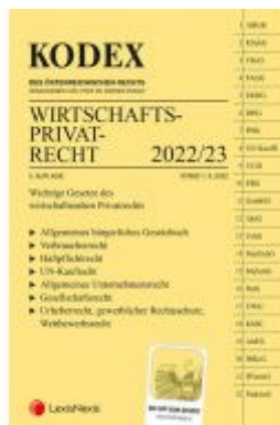
KODEX Wirtschaftsprivatrecht 2022/23 - inkl. App Ladenpreis: 29,80EUR