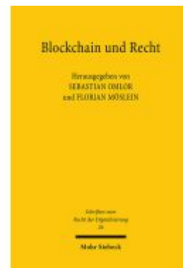
Blockchain und Recht Ladenpreis: 117,20EUR