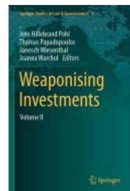
Weaponising Investments Ladenpreis: 175,99EUR