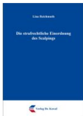
Die strafrechtliche Einordnung des Scalping Ladenpreis: 102,60EUR