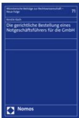
Die gerichtliche Bestellung eines Notgeschäftsführers für die GmbH Ladenpreis: 132,70EUR