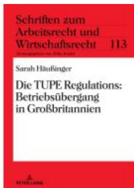
Die TUPE Regulations: Betriebsübergang in Großbritannien Ladenpreis: 56,50EUR

Wir haben andere Produkte gefunden, die Ihnen gefallen könnten!