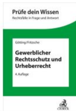
Gewerblicher Rechtsschutz und Urheberrecht Ladenpreis: 27,80EUR