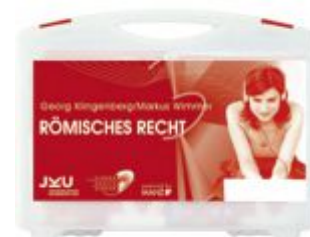
Medienkoffer Römisches Recht Ladenpreis: 173,80 EUR