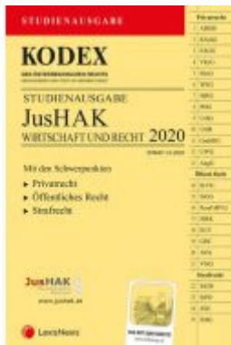
KODEX JusHAK Ladenpreis: 23,00 EUR