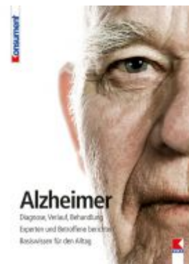
Alzheimer Ladenpreis: 19,90 EUR