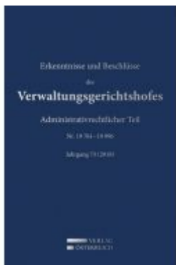
Erkenntnisse und Beschlüsse des Verwaltungsgerichtshofes Ladenpreis: 476,00 EUR