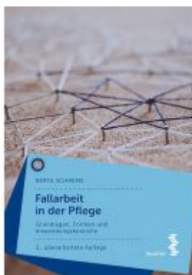
Fallarbeit in der Pflege Ladenpreis: 19,90 EUR