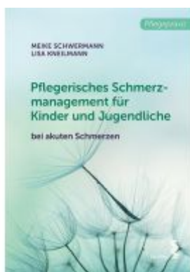
Pflegerisches Schmerzmanagement für Kinder und Jugendliche bei akuten Schmerzen Ladenpreis: 16,90 EUR