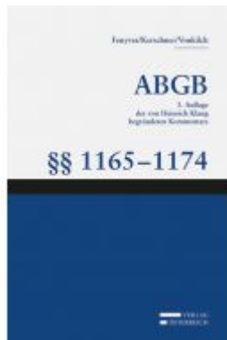
Großkommentar zum ABGB - Klang Kommentar Aktionspreis: 169,15 EUR Ladenpreis: 199,00 EUR