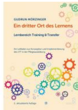
Ein dritter Ort des Lernens: Lernbereich Training & Transfer Ladenpreis: 24,90 EUR