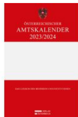
Österreichischer Amtskalender 2023/2024 Ladenpreis: 328,00EUR