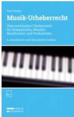
Musik-Urheberrecht Ladenpreis: 44,00EUR