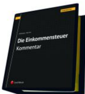
Die Einkommensteuer (EStG 1988) Band III - Kommentar Ladenpreis: 525,00EUR