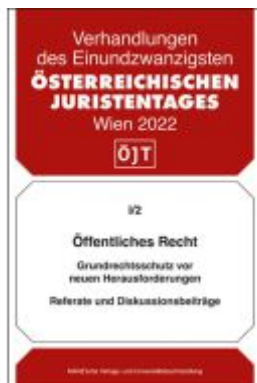
Öffentliches Recht Ladenpreis: 48,00EUR