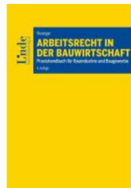
Arbeitsrecht in der Bauwirtschaft Ladenpreis: 52,00EUR