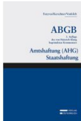
Großkommentar zum ABGB - Klang Kommentar Ladenpreis: 224,00EUR