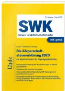
SWK-Spezial Die Körperschaftsteuererklärung 2020 Ladenpreis: 48,00EUR