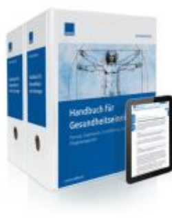
Handbuch für Gesundheitseinrichtungen Ladenpreis: 239,80EUR