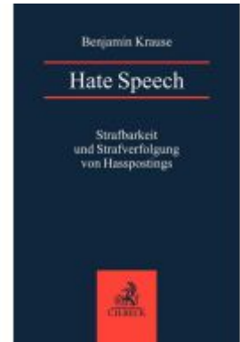
Hate Speech Ladenpreis: 40,10EUR