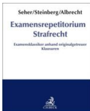
Examensrepetitorium Strafrecht Ladenpreis: 46,30EUR