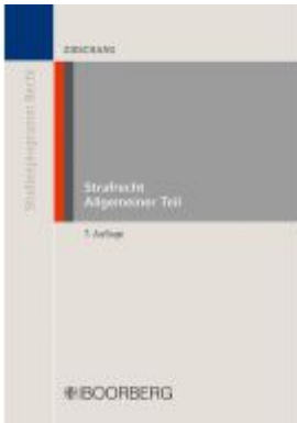
Strafrecht Allgemeiner Teil Ladenpreis: 26,70EUR