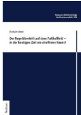
Der Regelübertritt auf dem Fußballfeld – in der heutigen Zeit ein strafreier Raum? Ladenpreis: 107,00EUR