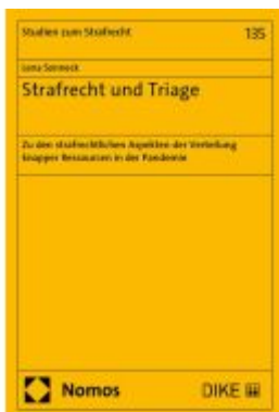
Strafrecht und Triage Ladenpreis: 117,20EUR

Wir haben andere Produkte gefunden, die Ihnen gefallen könnten!