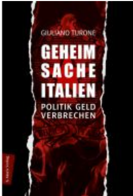
Geheimsache Italien Ladenpreis: 30,80EUR