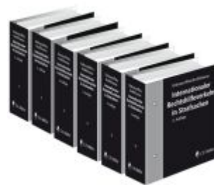
Internationaler Rechtshilfeverkehr in Strafsachen Ladenpreis: 323,90EUR