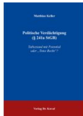
Politische Verdächtigung (§ 241a StGB) Ladenpreis: 91,40EUR