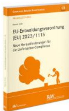
EU-Entwaldungsverordnung (EU) 2023/1115 Ladenpreis: 50,40EUR