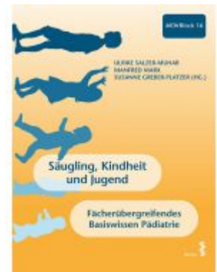
Säugling, Kindheit und Jugend Ladenpreis: 34,90 EUR