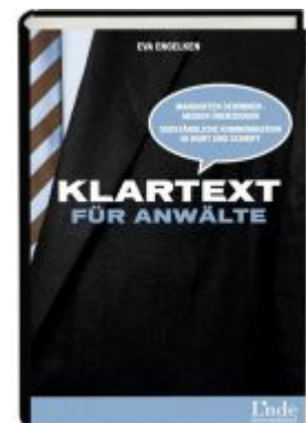
Klartext für Anwälte Ladenpreis: 25,60 EUR