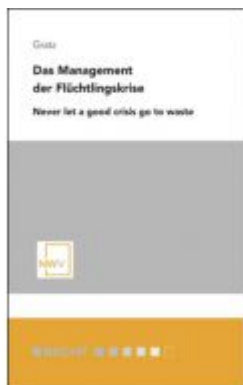
Das Management der Flüchtlingskrise