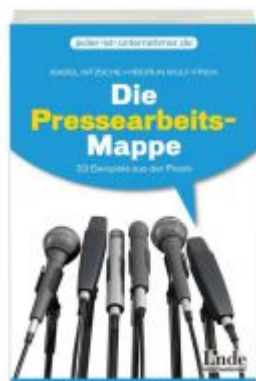
Die Pressearbeits-Mappe Ladenpreis: 19,90 EUR