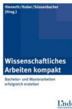
Wissenschaftliches Arbeiten kompakt Ladenpreis: 30,00 EUR