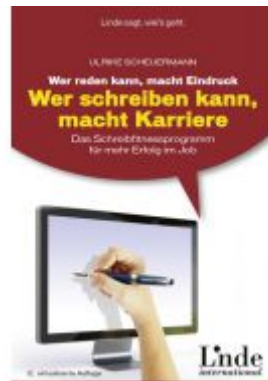
Wer reden kann, macht Eindruck - wer schreiben kann, macht Karriere Ladenpreis: 19,90 EUR