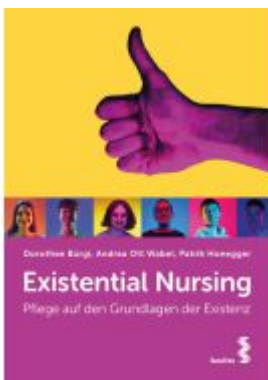
Existential Nursing Ladenpreis: 24,90EUR

Wir haben andere Produkte gefunden, die Ihnen gefallen könnten!