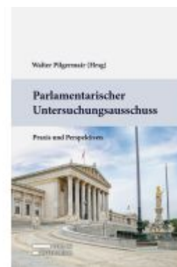
Parlamentarischer Untersuchungsausschuss Ladenpreis: 89,00EUR