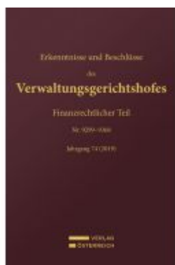
Erkenntnisse und Beschlüsse des Verwaltungsgerichtshofes Ladenpreis: 189,00EUR