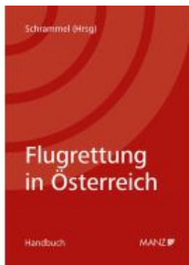
Flugrettung in Österreich Ladenpreis: 58,00EUR