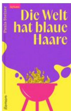
Die Welt hat blaue Haare Ladenpreis: 24,50EUR