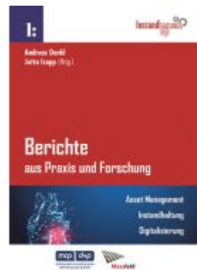
Berichte aus Praxis und Forschung - Asset Management. Instandhaltung. Digitalisierung. Ladenpreis: 79,90EUR