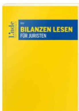
Bilanzen lesen für Juristen Ladenpreis: 56,00EUR