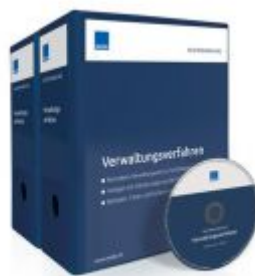
Mustersammlung Verwaltungsverfahren Ladenpreis: 207,90 EUR