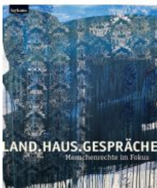
Land.Haus.Gespräche. Menschenrechte im Fokus Ladenpreis: 29,00 EUR