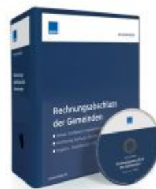
Rechnungsabschluss der Gemeinden Ladenpreis: 207,90 EUR