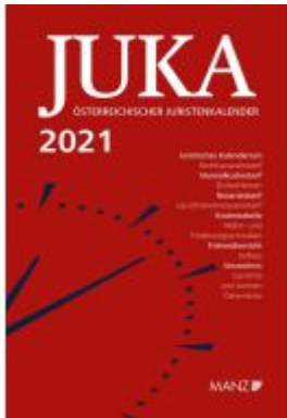
Österreichischer Juristenkalender 2021 JuKa Ladenpreis: 129,00 EUR