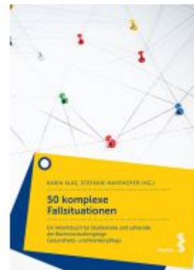
50 komplexe Fallsituationen Ladenpreis: 22,90 EUR