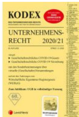
KODEX Unternehmensrecht 2020/21 Ladenpreis: 37,50 EUR