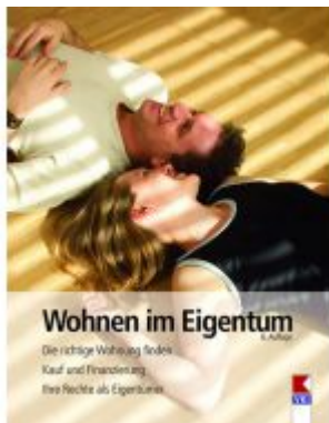
Wohnen im Eigentum Ladenpreis: 19,90 EUR

Wir haben andere Produkte gefunden, die Ihnen gefallen könnten!