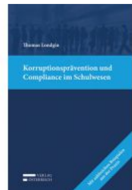
Korruptionsprävention und Compliance im Schulwesen Ladenpreis: 39,00 EUR