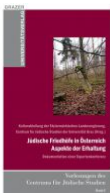
Jüdische Friedhöfe in Österreich - Aspekte der Erhaltung Ladenpreis: 12,90 EUR