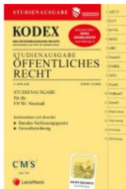
KODEX Öffentliches Recht 2020 Ladenpreis: 21,50 EUR

Wir haben andere Produkte gefunden, die Ihnen gefallen könnten!