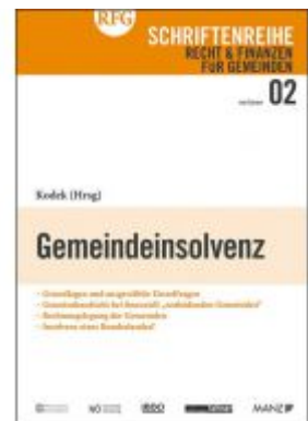
Gemeindeinsolvenz Ladenpreis: 24,00 EUR