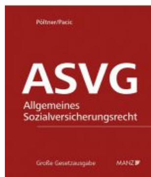
Allgemeine Sozialversicherung ASVG Ladenpreis: 338,00 EUR