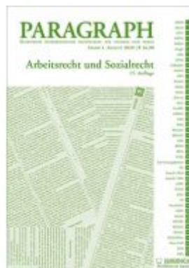
Paragraph - Arbeitsrecht und Sozialrecht Ladenpreis: 16,90 EUR