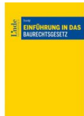
Einführung in das Baurechtsgesetz Ladenpreis: 24,00 EUR