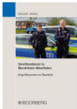
Streifendienst in Nordrhein-Westfalen Ladenpreis: 35,80EUR