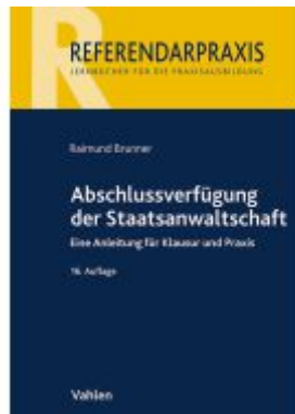
Abschlussverfügung der Staatsanwaltschaft Ladenpreis: 21,50EUR