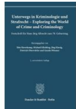
Unterwegs in Kriminologie und Strafrecht – Exploring the World of Crime and Criminology. Ladenpreis: 226,10EUR