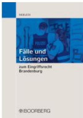
Fälle und Lösungen zum Eingriffsrecht Brandenburg Ladenpreis: 35,80EUR