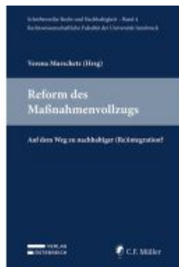
Reform des Maßnahmenvollzugs Ladenpreis: 44,00EUR