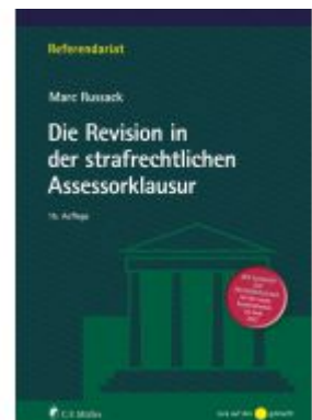
Die Revision in der strafrechtlichen Assessor Klausur Ladenpreis: 24,70EUR