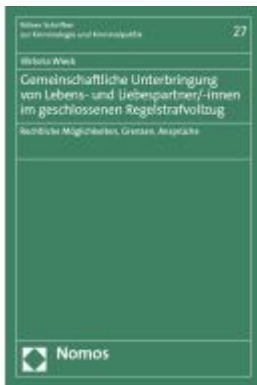
Gemeinschaftliche Unterbringung von Lebens- und Lebenspartner/-innen im geschlossenen Regelstrafvollzug Ladenpreis: 137,80EUR