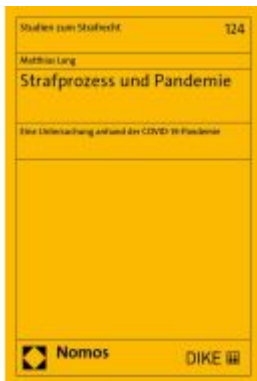
Strafrecht und Pandemie Ladenpreis: 112,10EUR