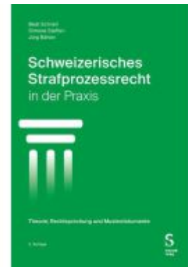
Schweizerisches Strafprozessrecht in der Praxis Ladenpreis: 109,40EUR