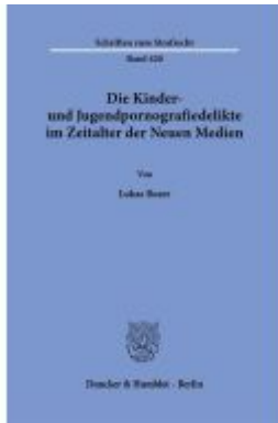
Die Kinder- und Jugendpornografiedelikte im Zeitalter der Neuen Medien. Ladenpreis: 102,70EUR