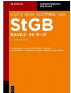
§§ 19-31 Ladenpreis: 309,00EUR