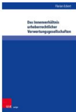
Das Innenverhältnis urheberrechtlicher Verwertungsgesellschaften Ladenpreis: 67,00EUR