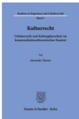
Kulturrecht. Ladenpreis: 92,50EUR