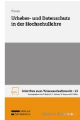
Urheber- und Datenschutz in der Hochschullehre Ladenpreis: 58,00EUR