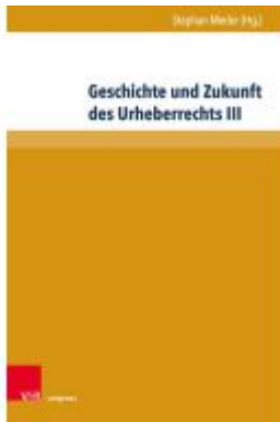
Geschichte und Zukunft des Urheberrechts III Ladenpreis: 47,00EUR