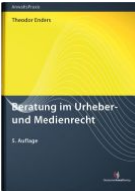
Beratung im Urheber- und Medienrecht Ladenpreis: 71,00EUR