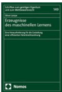
Erzeugnisse des maschinellen Lernens Ladenpreis: 122,40EUR