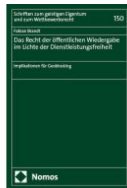
Das Recht der öffentlichen Wiedergabe im Lichte der Dienstleistungsfreiheit Ladenpreis: 86,40EUR