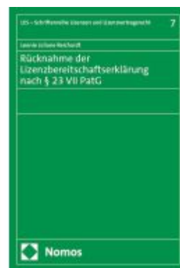
Rücknahme der Lizenzbereitschaftserklärung nach § 23 VII PatG Ladenpreis: 86,40EUR