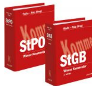
PAKET: Wr Komm StPO Kpl.-331.Lfg + 6 M Wr Komm StGB Kpl.-270.Lfg + 9 M Ladenpreis: 762,00 EUR