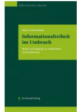
Informationsfreiheit im Umbruch Ladenpreis: 98,00 EUR