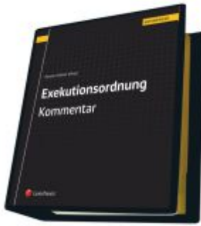
Exekutionsordnung - Kommentar Ladenpreis: 623,00 EUR