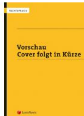
Geldwäscherei und Terrorismusfinanzierung Ladenpreis: 44,00 EUR