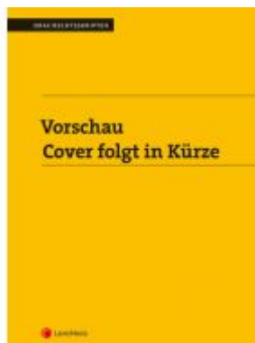
PAKET Edition Zivilrecht PLUS Ladenpreis: 143,00 EUR

Wir haben andere Produkte gefunden, die Ihnen gefallen könnten!