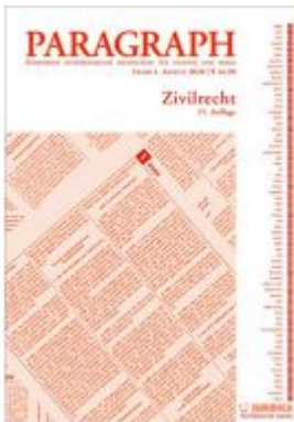
Paragraph - Zivilrecht Ladenpreis: 16,90 EUR