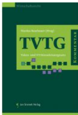
Kommentar zum TVTG Ladenpreis: 148,00 EUR