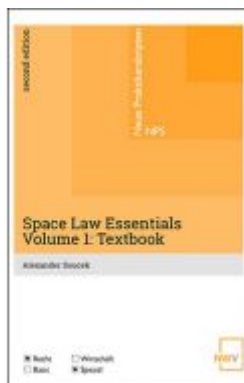
Space Law Essentials Ladenpreis: 20,00 EUR