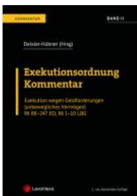
Exekutionsordnung - Kommentar Band 2 Ladenpreis: 214,00EUR