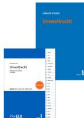
Kombipaket Umweltrecht und FlexLex Umweltrecht | Studium Ladenpreis: 53,00EUR