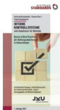
Interne Kontrollsysteme und Compliance für Betriebe Ladenpreis: 27,50EUR