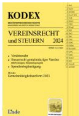
KODEX Vereinsrecht und Steuern Ladenpreis: 26,00EUR

Wir haben andere Produkte gefunden, die Ihnen gefallen könnten!