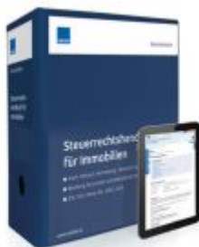
Steuerrechtshandbuch für Immobilien Ladenpreis: 239,80EUR