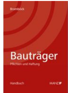
Bauträger Pflichten und Haftung Ladenpreis: 48,00EUR