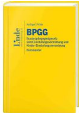
BPGG | Bundespflegegeldgesetz Ladenpreis: 59,00EUR