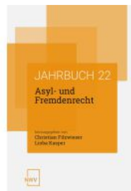
Asyl- und Fremdenrecht. Jahrbuch 2022 Ladenpreis: 84,00EUR