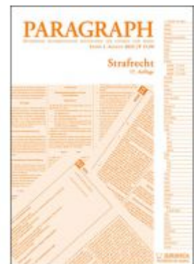
Paragraph - Strafrecht Ladenpreis: 15,90EUR