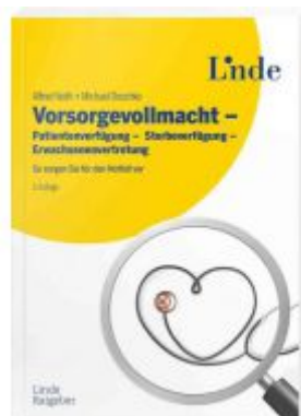
Vorsorgevollmacht - Patientenverfügung - Sterbeverfügung - Erwachsenenvertretung Ladenpreis: 22,00EUR