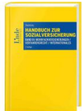
Handbuch zur Sozialversicherung Ladenpreis: 42,00EUR