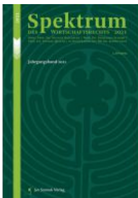
Spektrum des Wirtschaftsrechts Ladenpreis: 78,00EUR