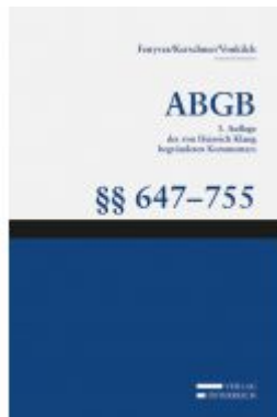
Großkommentar zum ABGB - Klang Kommentar Ladenpreis: 274,00EUR

Wir haben andere Produkte gefunden, die Ihnen gefallen könnten!