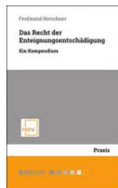
Das Recht der Enteignungsentschädigung Ladenpreis: 68,00 EUR