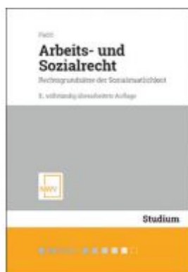
Arbeits- und Sozialrecht Ladenpreis: 32,00 EUR