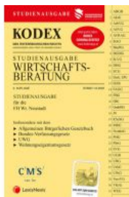
KODEX Wirtschaftsberatung 2020 Ladenpreis: 22,00 EUR