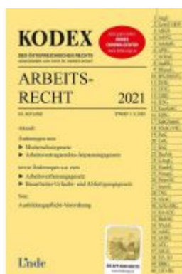
KODEX Arbeitsrecht 2021 Ladenpreis: 41,00 EUR