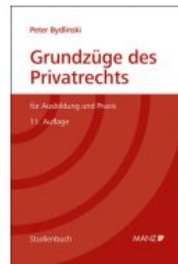
Grundzüge des Privatrechts Ladenpreis: 49,00 EUR