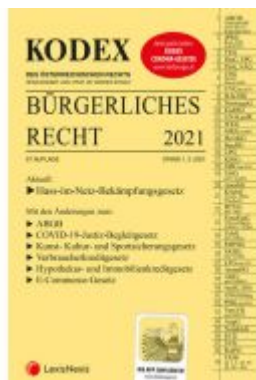
KODEX Bürgerliches Recht 2021 Ladenpreis: 36,00 EUR

Wir haben andere Produkte gefunden, die Ihnen gefallen könnten!