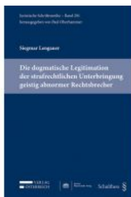
Die dogmatische Legitimation der strafrechtlichen Unterbringung geistig abnormer Rechtsbrecher Ladenpreis: 79,00 EUR