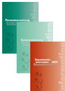
Steuerrechts-Paket 2021 Ladenpreis: 112,90 EUR