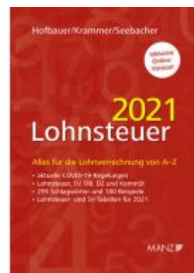
Lohnsteuer 2021 Ladenpreis: 59,00 EUR