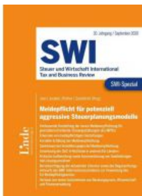
SWI-Spezial Meldepflicht für potenziell aggressive Steuerplanungsmodelle Ladenpreis: 58,00 EUR