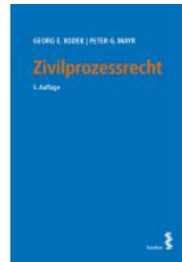
Zivilprozessrecht Ladenpreis: 44,00 EUR