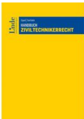
Handbuch Ziviltechnikerrecht Ladenpreis: 99,00 EUR