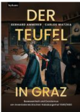
Der Teufel in Graz. Ladenpreis: 39,00 EUR

Wir haben andere Produkte gefunden, die Ihnen gefallen könnten!