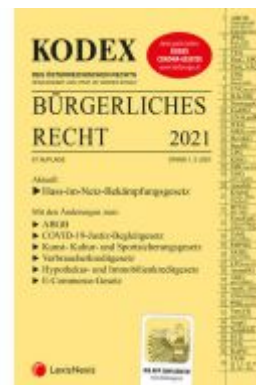
KODEX Bürgerliches Recht 2021 Ladenpreis: 36,00 EUR