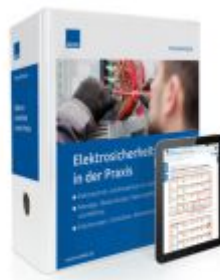
Elektrosicherheit in der Praxis Ladenpreis: 261,45 EUR