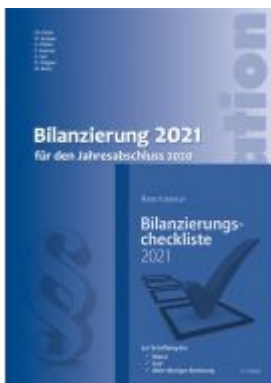
Kombi-Paket Bilanzierung 2021 Ladenpreis: 49,80 EUR