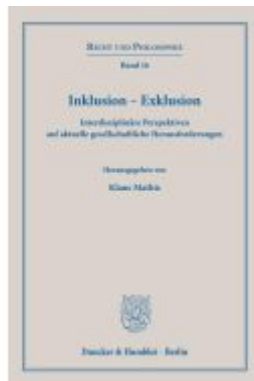
Inklusion – Exklusion Ladenpreis: 102,70EUR