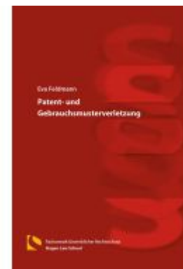
Patent- und Gebrauchsmusterverletzung Ladenpreis: 25,70EUR