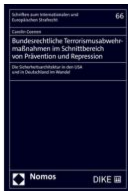
Bundesrechtliche Terrorismusabwehrmaßnahmen im Schnittbereich von Prävention und Repression Ladenpreis: 163,50EUR