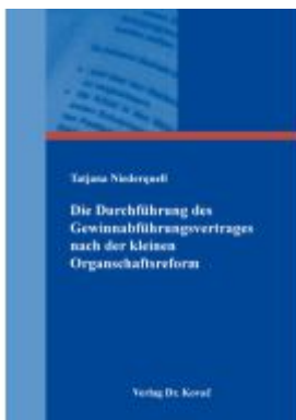
Die Durchführung des Gewinnabführungsvertrages nach der kleinen Organschaftsreform Ladenpreis: 91,40EUR