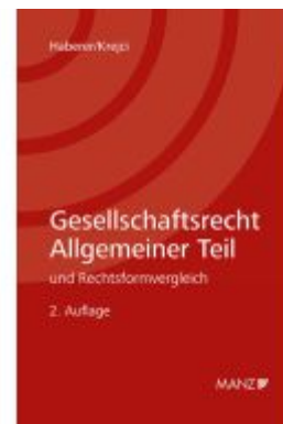
Gesellschaftsrecht Allgemeiner Teil Ladenpreis: 69,00EUR