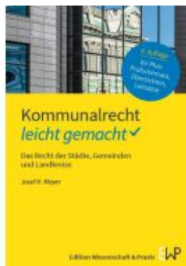
Kommunalrecht – leicht gemacht Ladenpreis: 15,40EUR