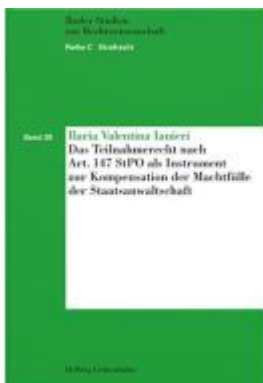
Das Teilnahmerecht nach Art. 147 StPO als Instrument zur Kompensation der Machtfülle der Staatsanwaltschaft Ladenpreis: 86,00EUR