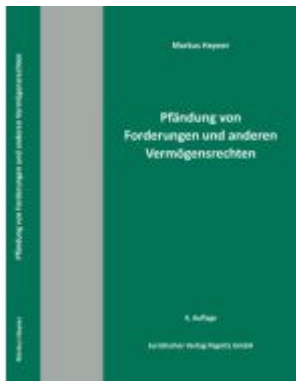
Pfändung von Forderungen und anderen Vermögensrechten Ladenpreis: 23,70EUR

Wir haben andere Produkte gefunden, die Ihnen gefallen könnten!