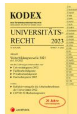
KODEX Universitätsrecht 2023 Ladenpreis: 62,00EUR