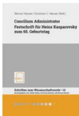
Concilium Administrator Ladenpreis: 68,00EUR