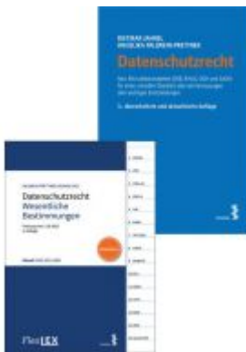
Kombipaket Datenschutzrecht und FlexLex Datenschutzrecht – Wesentliche Bestimmungen Ladenpreis: 38,00EUR