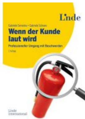
Wenn der Kunde laut wird Ladenpreis: 24,90EUR