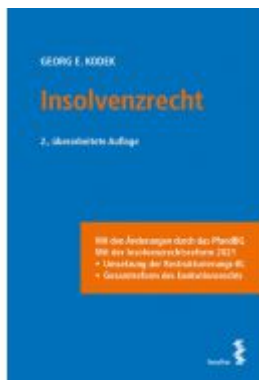
Insolvenzrecht Ladenpreis: 36,00EUR

Wir haben andere Produkte gefunden, die Ihnen gefallen könnten!