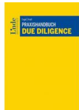
Praxishandbuch Due Diligence Ladenpreis: 68,00EUR