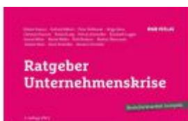
Ratgeber Unternehmenskrise Ladenpreis: 39,00EUR