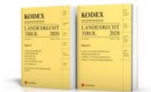
KODEX Landesrecht Tirol 2020 Ladenpreis: 128,00 EUR