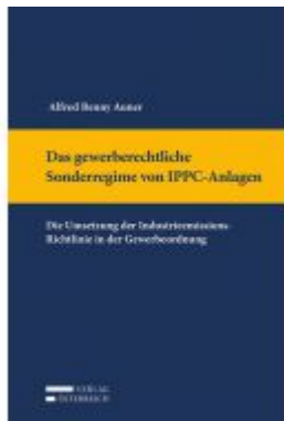
Das gewerberechtliche Sonderregime von IPPC-Anlagen Ladenpreis: 129,00 EUR

Wir haben andere Produkte gefunden, die Ihnen gefallen könnten!