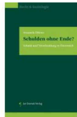
Schulden ohne Ende? Ladenpreis: 85,00 EUR