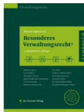
Besonderes Verwaltungsrecht 3 Ladenpreis: 55,00 EUR