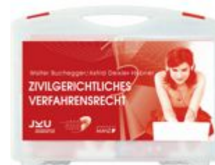
Medienkoffer Zivilgerichtliches Verfahrensrecht Ladenpreis: 280,50 EUR