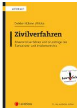
Zivilverfahren Ladenpreis: 64,00 EUR