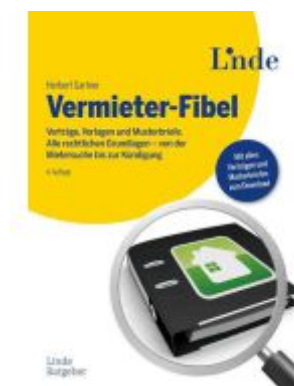
Vermieter-Fibel Ladenpreis: 32,00EUR