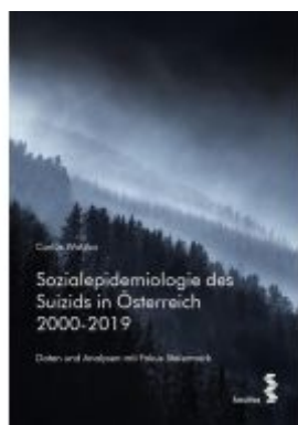
Sozialepidemiologie des Suizids in Österreich 2000-2019 Ladenpreis: 26,90EUR