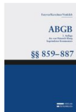
Großkommentar zum ABGB - Klang Kommentar Ladenpreis: 544,00EUR