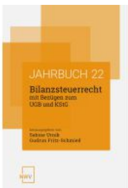
Bilanzsteuerrecht mit Bezügen zum UGB und KStG Ladenpreis: 62,00EUR