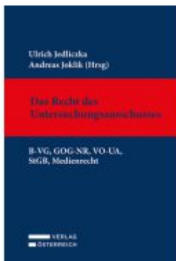
Das Recht des Untersuchungsausschusses Ladenpreis: 139,00EUR

Wir haben andere Produkte gefunden, die Ihnen gefallen könnten!