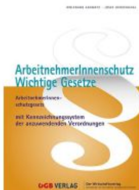
ArbeitnehmerInnenenschutz. Ladenpreis: 72,80EUR