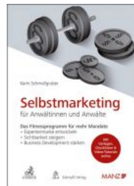
Selbstmarketing für Anwältinnen und Anwälte Das Fitnessprogramm für mehr Mandate Ladenpreis: 48,00EUR