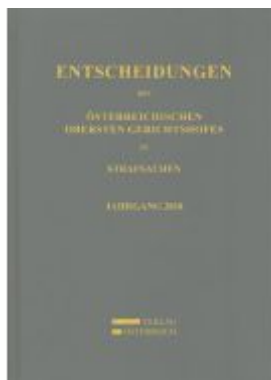
Entscheidungen des Österreichischen Obersten Gerichtshofes in Strafsachen Ladenpreis: 164,00EUR