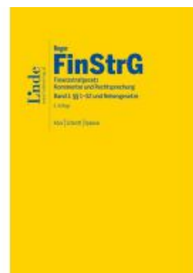
FinStrG | Finanzstrafgesetz Ladenpreis: 198,00EUR