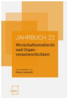
Wirtschaftsstrafrecht und Organverantwortlichkeit Ladenpreis: 68,00EUR