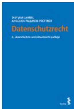
Datenschutzrecht Ladenpreis: 28,00EUR