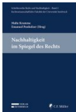
Nachhaltigkeit im Spiegel des Rechts Ladenpreis: 64,00EUR

Wir haben andere Produkte gefunden, die Ihnen gefallen könnten!