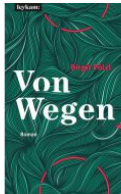
Von Wegen Ladenpreis: 21,00 EUR