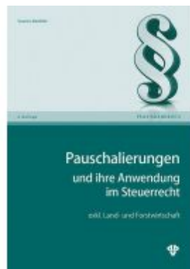
Pauschalierungen und ihre Anwendung im Steuerrecht Ladenpreis: 39,60 EUR