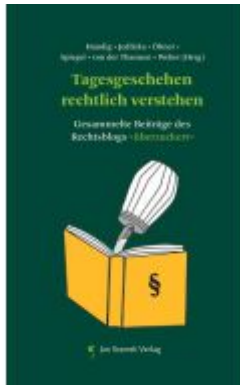
Tagesgeschehen rechtlich verstehen Ladenpreis: 14,90EUR