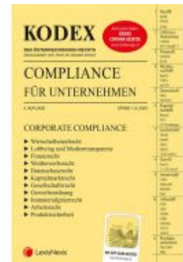
KODEX Compliance für Unternehmen 2020 Ladenpreis: 73,00 EUR