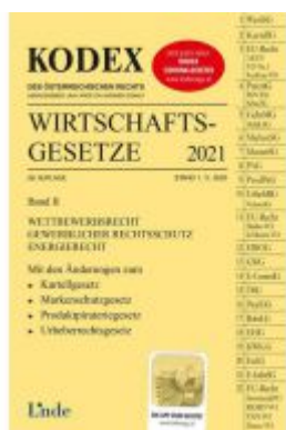
KODEX Wirtschaftsgesetze Band II 2021 Ladenpreis: 59,00 EUR