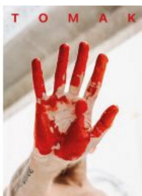
TOMAK Ladenpreis: 48,00 EUR