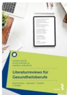
Literaturreviews für Gesundheitsberufe Ladenpreis: 28,90EUR