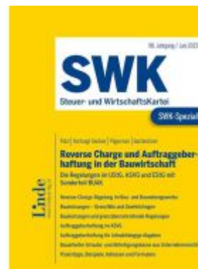
SWK-Spezial Reverse Charge und Auftraggeberhaftung in der Bauwirtschaft Ladenpreis: 35,00EUR