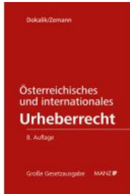
Österreichisches und internationales Urheberrecht Ladenpreis: 328,00EUR