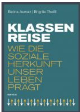
Klassenreise Ladenpreis: 19,90 EUR

Wir haben andere Produkte gefunden, die Ihnen gefallen könnten!