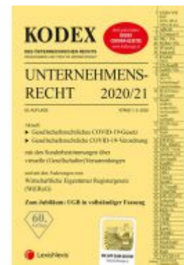
KODEX Unternehmensrecht 2020/21 Ladenpreis: 37,50 EUR