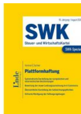
SWK-Spezial Plattformhaftung Ladenpreis: 26,00 EUR