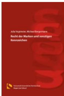
Recht der Marken und sonstigen Kennzeichen Ladenpreis: 25,70EUR