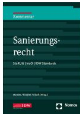
Sanierungsrecht Ladenpreis: 163,50EUR