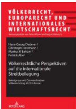
Völkerrechtliche Perspektiven auf die internationale Streitbeilegung Ladenpreis: 71,90EUR