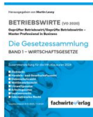
Wirtschaftsgesetze Ladenpreis: 30,70EUR