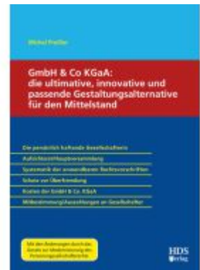
GmbH & Co KGaA: die ultimative, innovative und passende Gestaltungsalternative für den Mittelstand Ladenpreis: 102,80EUR