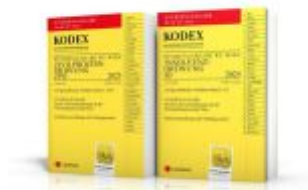
KODEX ZPO - IO für die WU 2025 - inkl. App Ladenpreis: 26,00EUR