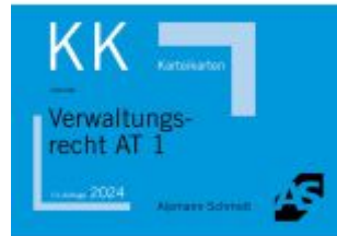
Karteikarten Verwaltungsrecht AT 1 Ladenpreis: 14,30EUR