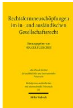
Rechtsformneuschöpfungen im in- und ausländischen Gesellschaftsrecht Ladenpreis: 153,20EUR