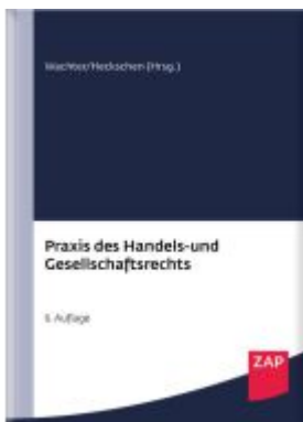
Praxis des Handels- und Gesellschaftsrechts Ladenpreis: 307,40EUR