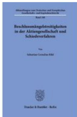
Beschlussmängelstreitigkeiten in der Aktiengesellschaft und Schiedsverfahren Ladenpreis: 102,70EUR