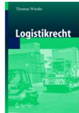
Logistikrecht Ladenpreis: 25,65EUR