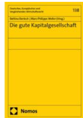
Die gute Kapitalgesellschaft Ladenpreis: 81,30EUR