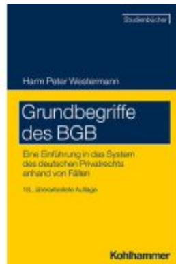
Grundbegriffe des BGB Ladenpreis: 29,90EUR