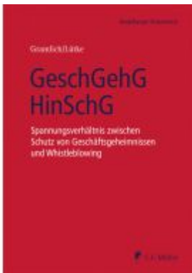
GeschGehG/HinSchG Ladenpreis: 163,50EUR