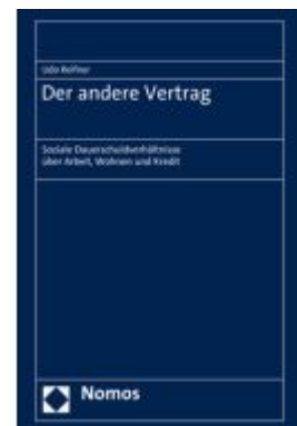
Der andere Vertrag Ladenpreis: 142,90EUR