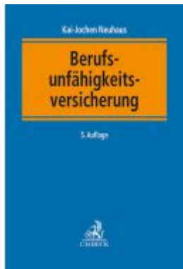
Berufsunfähigkeitsversicherung Ladenpreis: 236,50EUR