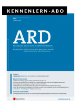
ARD Zeitschrift - Kennenlern-Abo (4 Hefte) Ladenpreis: 50,00EUR