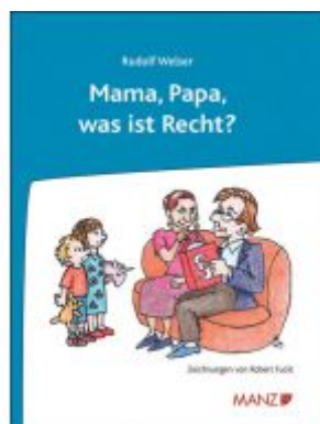
Mama, Papa, was ist Recht? Ladenpreis: 18,80 EUR