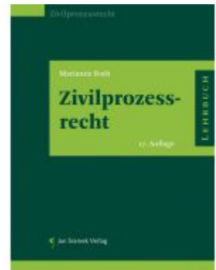
Zivilprozessrecht Ladenpreis: 55,00EUR