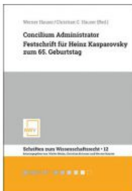
Concilium Administrator Ladenpreis: 68,00 EUR