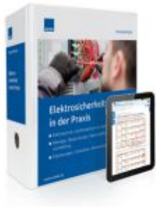
Elektrosicherheit in der Praxis Ladenpreis: 273,90 EUR