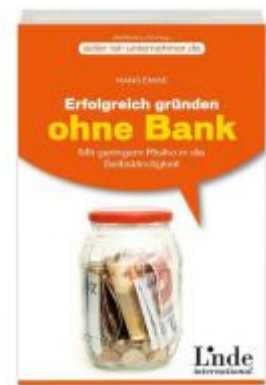
Erfolgreich gründen ohne Bank Ladenpreis: 18,40 EUR