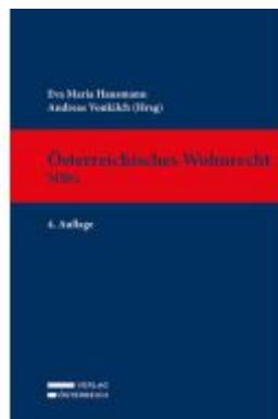
Österreichisches Wohnrecht - MRG Ladenpreis: 269,00EUR