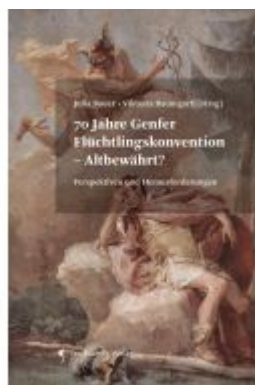
70 Jahre Genfer Flüchtlingskonvention - Altbewährt? Ladenpreis: 65,00EUR