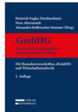
GmbHG - Gesetz über Gesellschaften mit beschränkter Haftung Ladenpreis: 449,00EUR