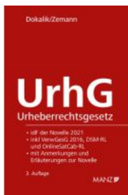
Urheberrechtsgesetz Ladenpreis: 74,00EUR