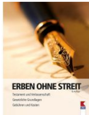
Erben ohne Streit Ladenpreis: 19,90 EUR