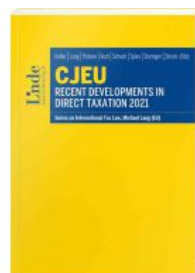
CJEU - Recent Developments in Direct Taxation 2021 Ladenpreis: 85,00EUR