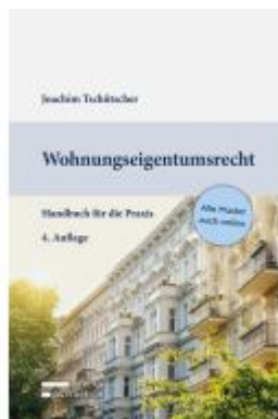
Wohnungseigentumsrecht Ladenpreis: 69,00EUR