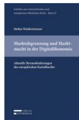
Marktabgrenzung und Marktmacht in der Digitalökonomie Ladenpreis: 49,00 EUR