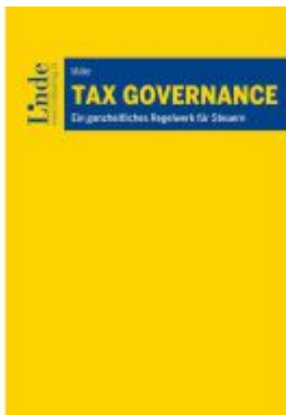
Tax Governance Ladenpreis: 59,00EUR

Wir haben andere Produkte gefunden, die Ihnen gefallen könnten!