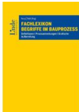
Fachlexikon Begriffe im Bauprozess Ladenpreis: 89,00EUR