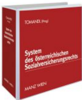
System des österreichischen Sozialversicherungsrechts Ladenpreis: 258,00 EUR