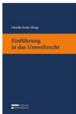
Einführung in das Umweltrecht Ladenpreis: 28,00 EUR