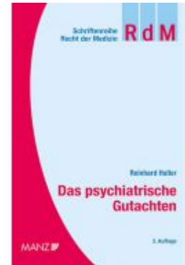
Das psychiatrische Gutachten Ladenpreis: 78,00 EUR