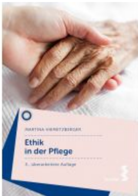
Ethik in der Pflege Ladenpreis: 19,90 EUR