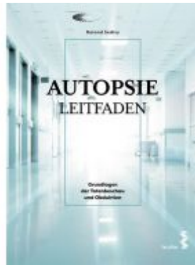
Autopsie Leitfaden Ladenpreis: 29,90 EUR