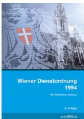
Wiener Dienstordnung 1994 Ladenpreis: 33,00EUR