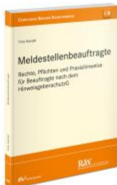
Meldestellenbeauftragte Ladenpreis: 71,00EUR