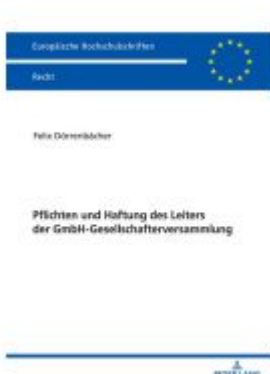
Pflichten und Haftung des Leiters der GmbH-Gesellschafterversammlung Ladenpreis: 61,60EUR