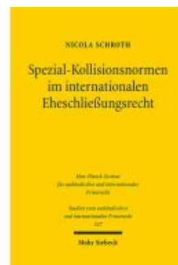
Spezial-Kollisionsnormen im internationalen Eheschließungsrecht Ladenpreis: 96,70EUR