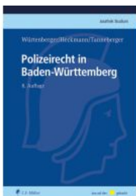
Polizeirecht in Baden-Württemberg Ladenpreis: 29,90EUR