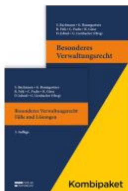
Kombipaket Besonderes Verwaltungsrecht: Lehrbuch & Fälle und Lösungen Ladenpreis: 78,00EUR