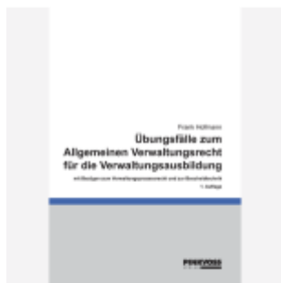
Übungsfälle zum Allgemeinen Verwaltungsrecht für die Verwaltungsbildung Ladenpreis: 23,60EUR