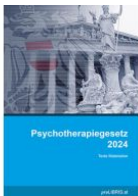
Psychotherapiegesetz 2024 Ladenpreis: 28,00EUR