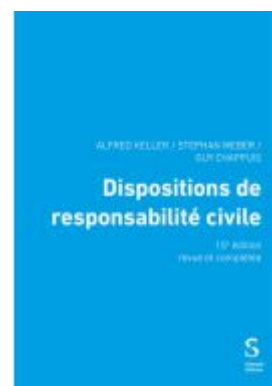
Dispositions de responsabilité civile Ladenpreis: 56,50EUR