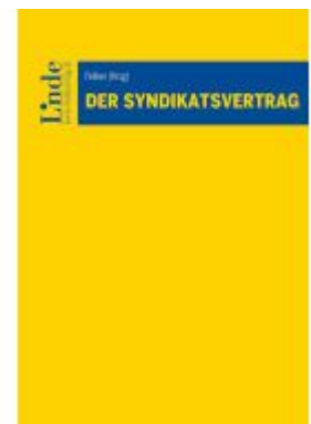
Der Syndikatsvertrag Ladenpreis: 55,00EUR