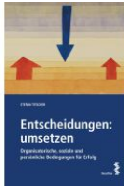
Entscheidungen: umsetzen Ladenpreis: 38,00EUR