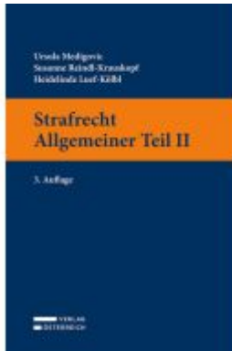
Strafrecht Allgemeiner Teil II Ladenpreis: 39,00EUR