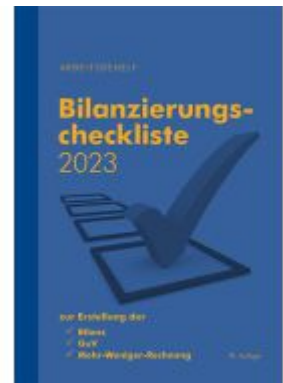
Bilanzierungscheckliste 2023 Ladenpreis: 14,85EUR