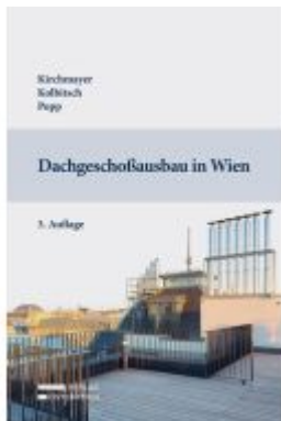
Dachgeschoßausbau in Wien Ladenpreis: 79,00EUR

Wir haben andere Produkte gefunden, die Ihnen gefallen könnten!