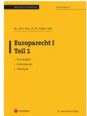
Europarecht I – Teil 1 (Skriptum) Ladenpreis: 30,00EUR