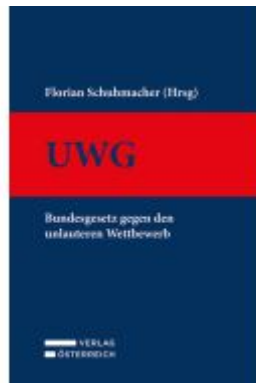
UWG Ladenpreis: 169,00EUR