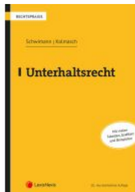
Unterhaltsrecht Ladenpreis: 75,00EUR