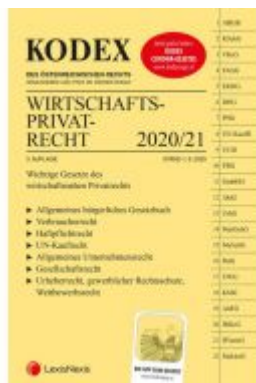
KODEX Wirtschaftsprivatrecht 2020/21 Ladenpreis: 29,80 EUR