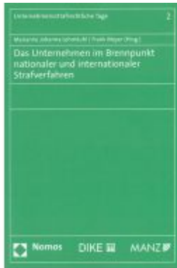
Das Unternehmen im Brennpunkt nationaler und internationaler Strafverfahren Ladenpreis: 64,00 EUR