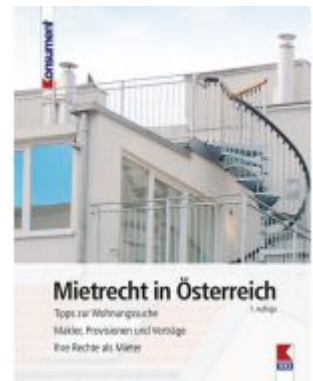
Mietrecht in Österreich Ladenpreis: 19,90 EUR