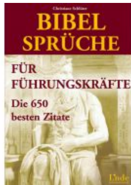
Bibelsprüche für Führungskräfte Ladenpreis: 18,50 EUR