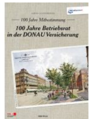
100 Jahre Mitbestimmung Ladenpreis: 29,90 EUR