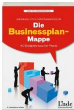
Die Businessplan-Mappe Ladenpreis: 19,90 EUR

Wir haben andere Produkte gefunden, die Ihnen gefallen könnten!