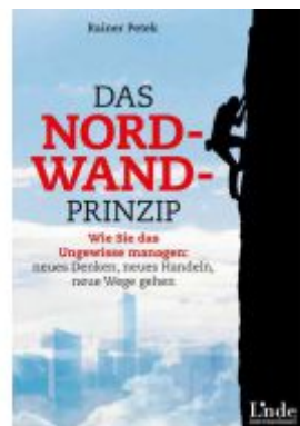
Das Nordwand-Prinzip Ladenpreis: 19,90 EUR