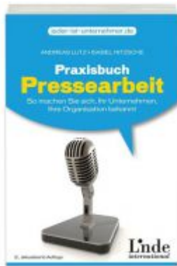
Praxisbuch Pressearbeit Ladenpreis: 18,40 EUR